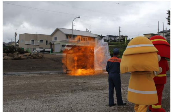
L P ガス爆発実験