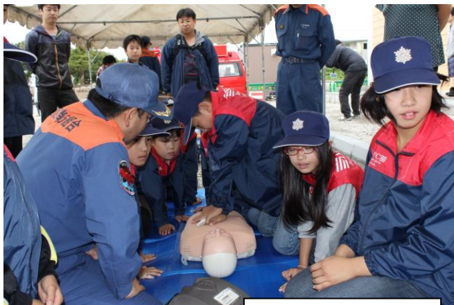
応急処置体験訓練