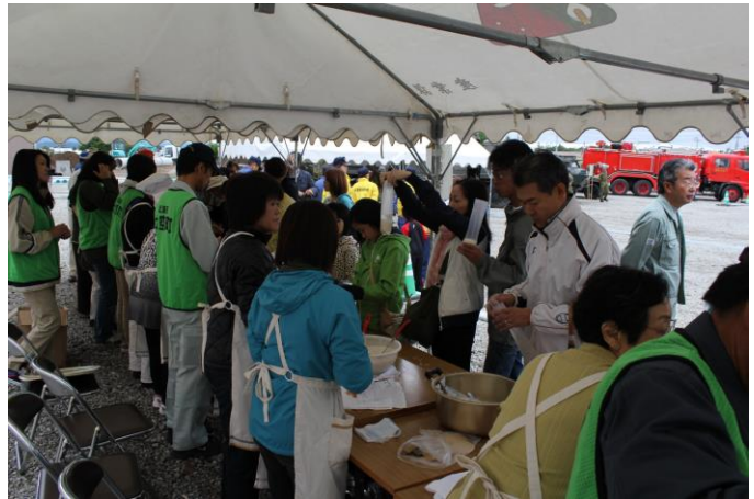
赤十字奉仕団による炊き出し