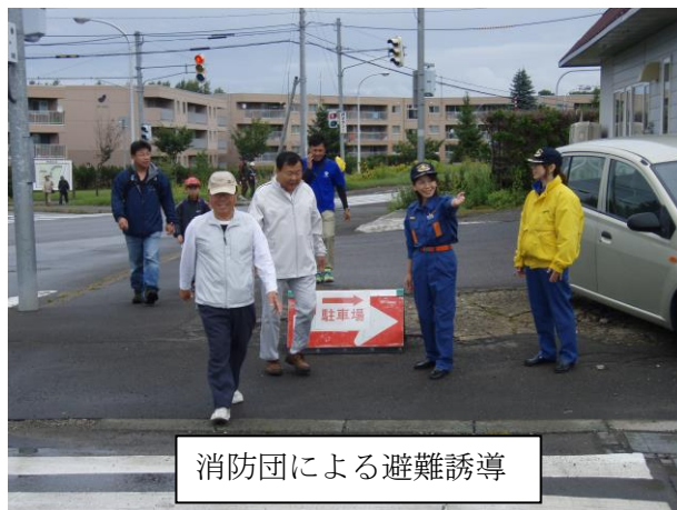
消防団による避難誘導

これらの訓練で、参加した地域住民の防災に対する意識向上に繋がっていくものと期待しています。