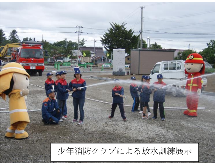
少年消防クラブによる放水訓練展示