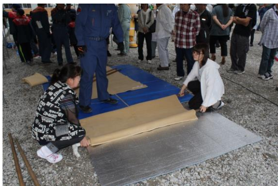
簡易担架作成訓練