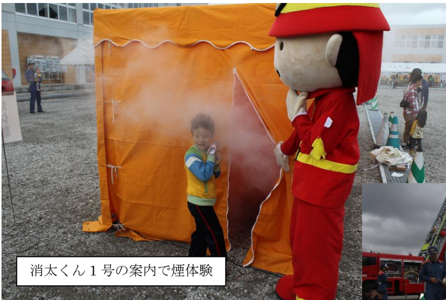
消太くん 1 号の案内で煙体験