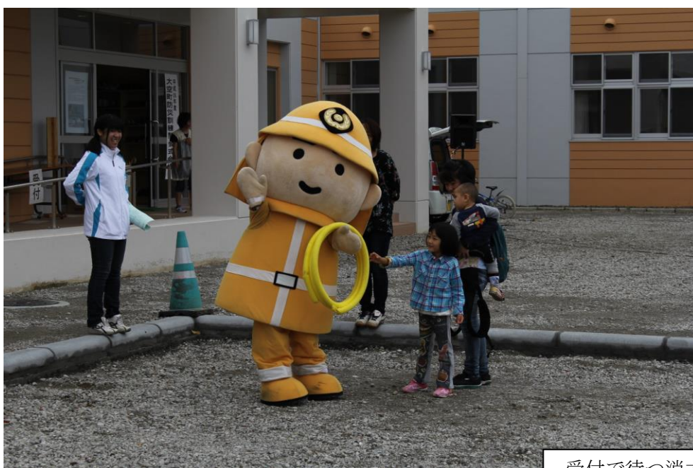
受付で待つ消太くん2号