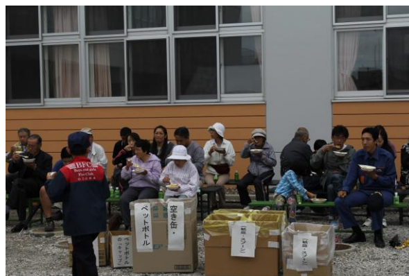
炊き出し(カレーライス)の試食風景